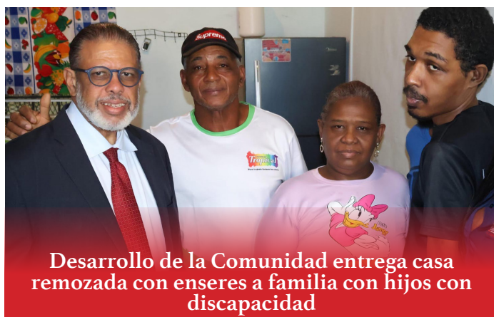
Desarrollo de la Comunidad entrega casa remozada con enseres a familia con hijos con discapacidad